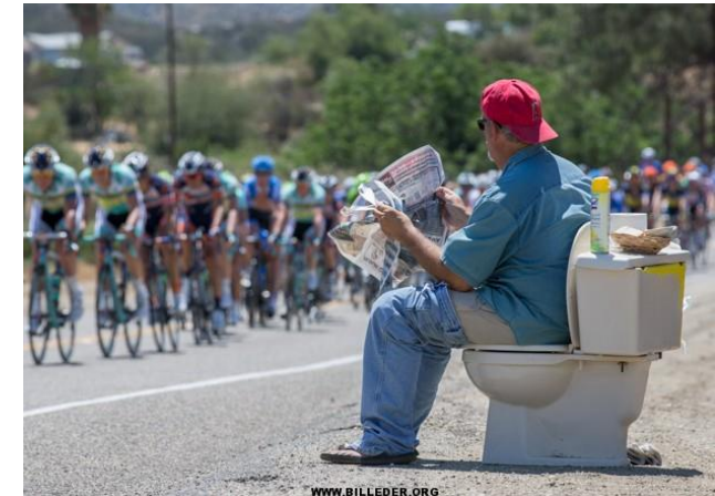
13 forsyningsmedarbejdere fra 7 forsyninger