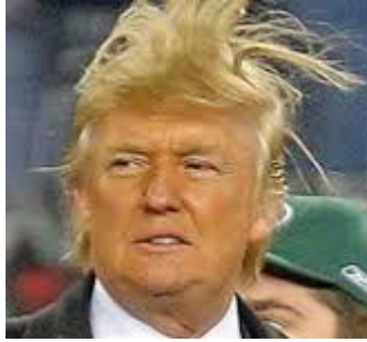
3 øvrige fra 3 firmaer