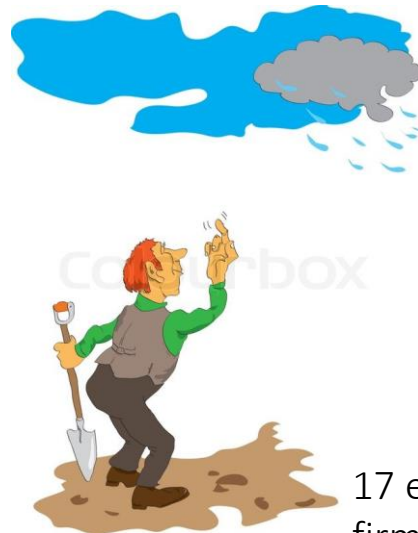
17 entreprenører fra 8 firmaer