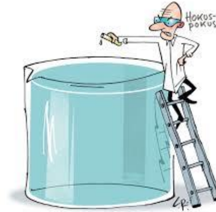
11 rådgivere fra 5 firmaer