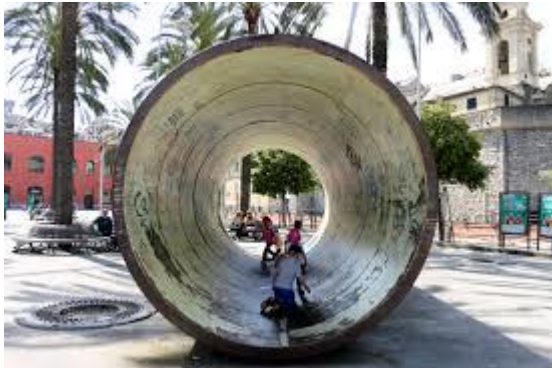
3 leverandører fra 2 firmaer